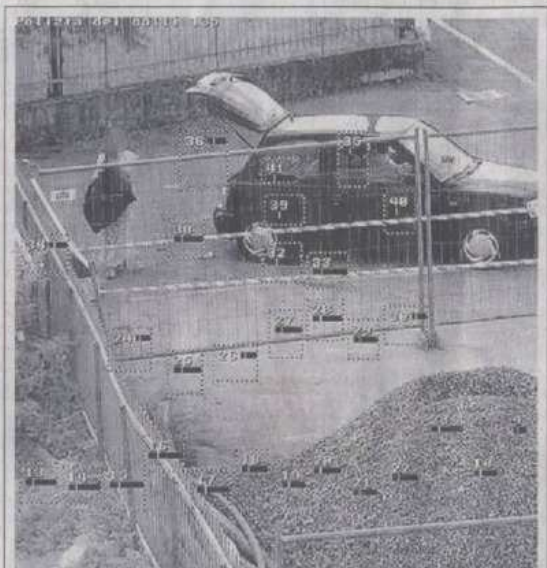
Una delle immagini che documenta gli scarichi abusivi di rifiuti

SAN PAOLO D'ARGON Telecamere nascoste per scoprire e denunciare chi getta i rifiuti in strada a San Paolo d'Argon.